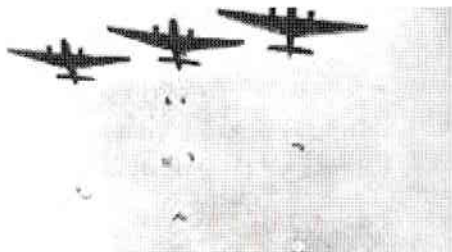
Lansarea parașutiștilor germani - Fallschirmjäger dintr-o formație „Kette” de trei avioane JU52, în timpul Operațiunii Mercur, 20 mai 1941

Al Doilea Război Mondial a fost momentul de apogeu al utilizării pe scară mare a acestor luptători de elită ce au aplicat cu un curaj extraordinar, pentru prima dată, conceptul „Învăluirii pe Verticală“.