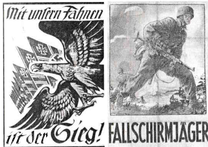
Postere de recrutare Luftwaffe pentru specialitatea Fallschirmjäger. Primul din 1939 și al doilea din 1941.

„În ianuarie 1939, Maiorul Richard Heidrich, Comandantul Batalionului 2 FSJ (Fallschirmjäger) conduce unul din interviurile de selecție pentru extinderea unității (trupele de parașutiști fuseseră înființate de mai puțin de 3 ani).