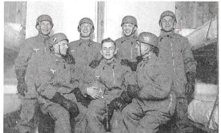
Începutul Fallschirmjäger în perioada de pace. În această imagine sunt echipați cu primul model combinezon de salt și cu căștile specifice și poartă deja însemnul Luftwaffe.

Armata terestră începe să-și formeze, aproape simultan cu Luftwaffe, propria unitate de parașutiști și în scurt timp, aceasta este integrată în batalionul de parașutiști Luftwaffe (la cererea expresă a lui Göring).